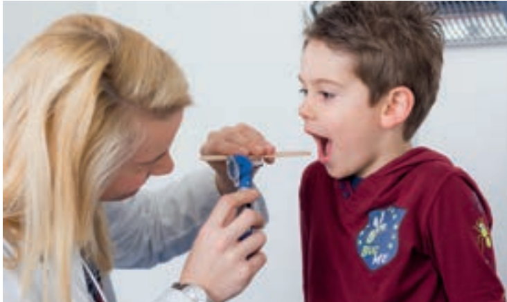
Mach schön „aaah“!