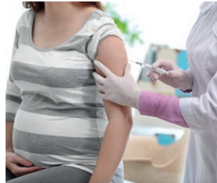
Die Grippeimpfung ist auch bei Schwangeren ohne erhöhtes Risiko möglich.

Auch bei Schwangeren ist die Impfung ohne erhöhtes Risiko möglich.