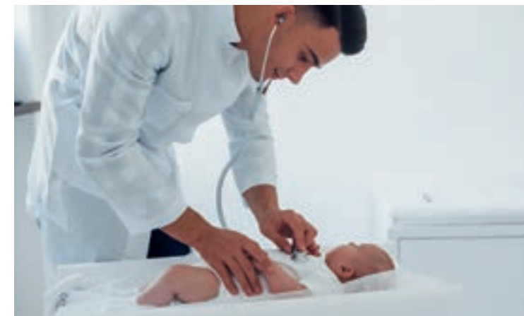
Fieber bei Neugeborenen sollte immer ärztlich abgeklärt werden.