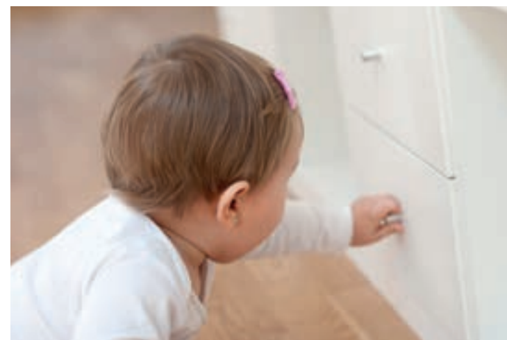
Baby auf Erkundungstour