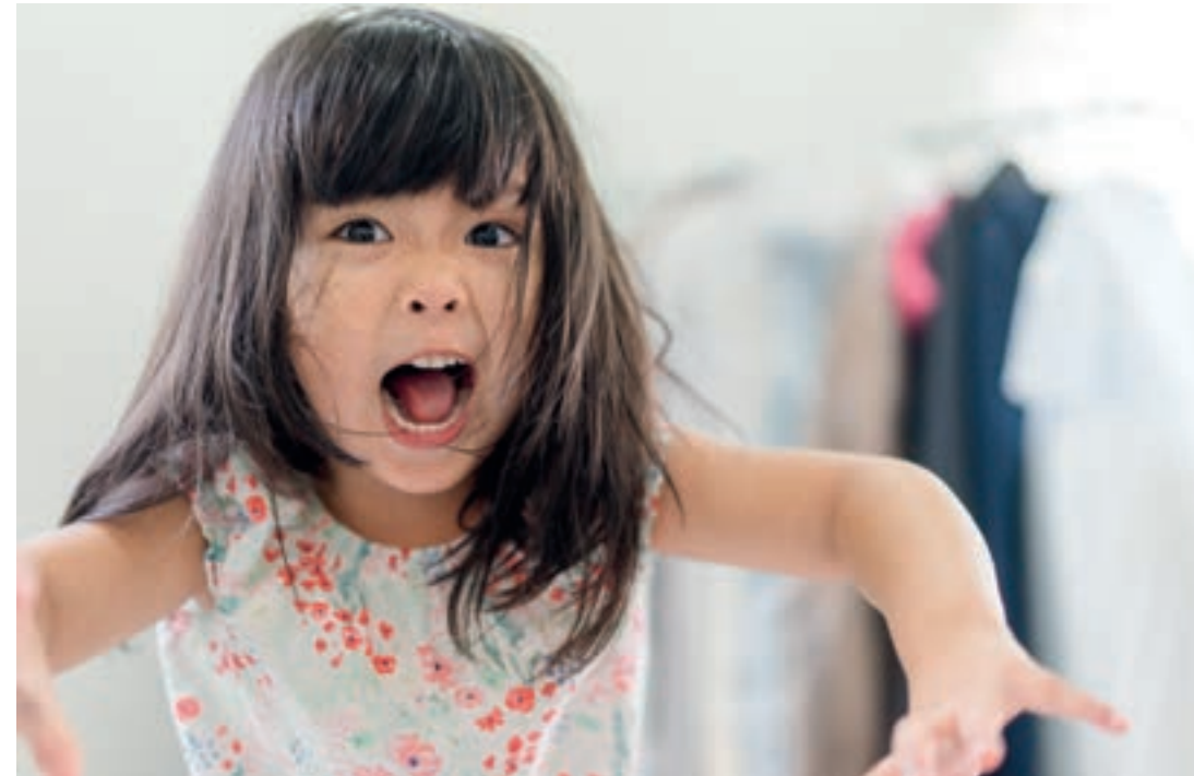
Aggressives Verhalten: oft nur eine vorübergehende Entwicklungsphase

Oft ist aggressives Verhalten nur eine vorübergehende Phase. Ein gewisses Maß an aggressivem Verhalten ist sogar notwendiger Bestandteil einer gesunden Entwicklung, um zu lernen, für sich und seine Bedürfnisse einzustehen. So ist etwa die sogenannte Trotzphase zwischen dem 2. und 3. Lebensjahr ein wichtiger Meilenstein in der natürlichen Entwicklung eines Kindes und kann durchaus mit aggressivem Verhalten einhergehen. Kinder müssen im familiären Umfeld aber auch lernen, ihre Impulse soweit zu kontrollieren, dass niemand zu Schaden kommt. Die Vorbildfunktion der Eltern ist dafür eine wichtige Voraussetzung. Teilweise kommt es bei Kindern aber auch zu einem verstärkten aggressiven Verhalten, das sich beispielsweise in blinder Zerstörungswut äußert. In diesen Fällen können Fachleute aus Kinderpsychologie, Kinderpsychotherapie oder auch Kinderpsychiatrie weiterführende Hilfe anbieten.