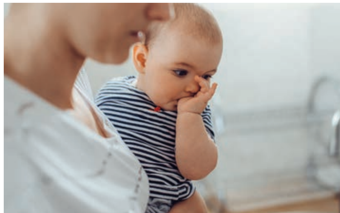
Daumenlutschen verursacht Zahnfehlstellungen.

Da der Daumen hart und nicht kiefergerecht geformt ist, entstehen durch das Daumenlutschen mit der Zeit Zahnfehlstellungen und schwer korrigierbare Fehlbildungen am Kiefer. Es wird daher empfohlen, den Schnuller vorzuziehen.