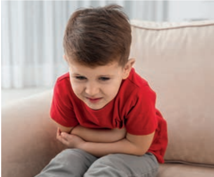
Verstopfung ist schmerzhaft!

Bei Kleinkindern und Schulkindern versteht man unter einer Verstopfung einen seltenen oder schwierigen Stuhlgang. Harter Stuhl ohne Beschwerden ist noch nicht als Verstopfung anzusehen. Jedoch können Kinder, die regelmäßig nur kleine Stuhlportionen entleeren, eine Verstopfung haben. Kein Grund zur Sorge besteht, wenn die Verstopfung nicht länger als drei Tage andauert, das Kind kein Blut im Stuhl hat und beim Stuhlgang keine Schmerzen verspürt.