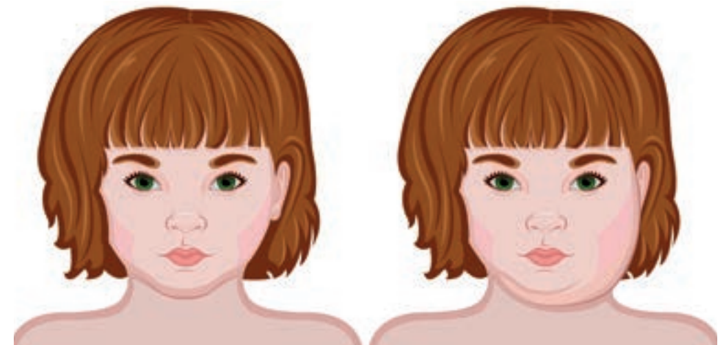
So sieht ein gesundes Kind aus

Wer einmal an Mumps erkrankt war, besitzt einen lebenslangen Schutz. Man kann gegen Mumps impfen, daher tritt die Erkrankung heute nicht mehr so häufig auf wie früher.