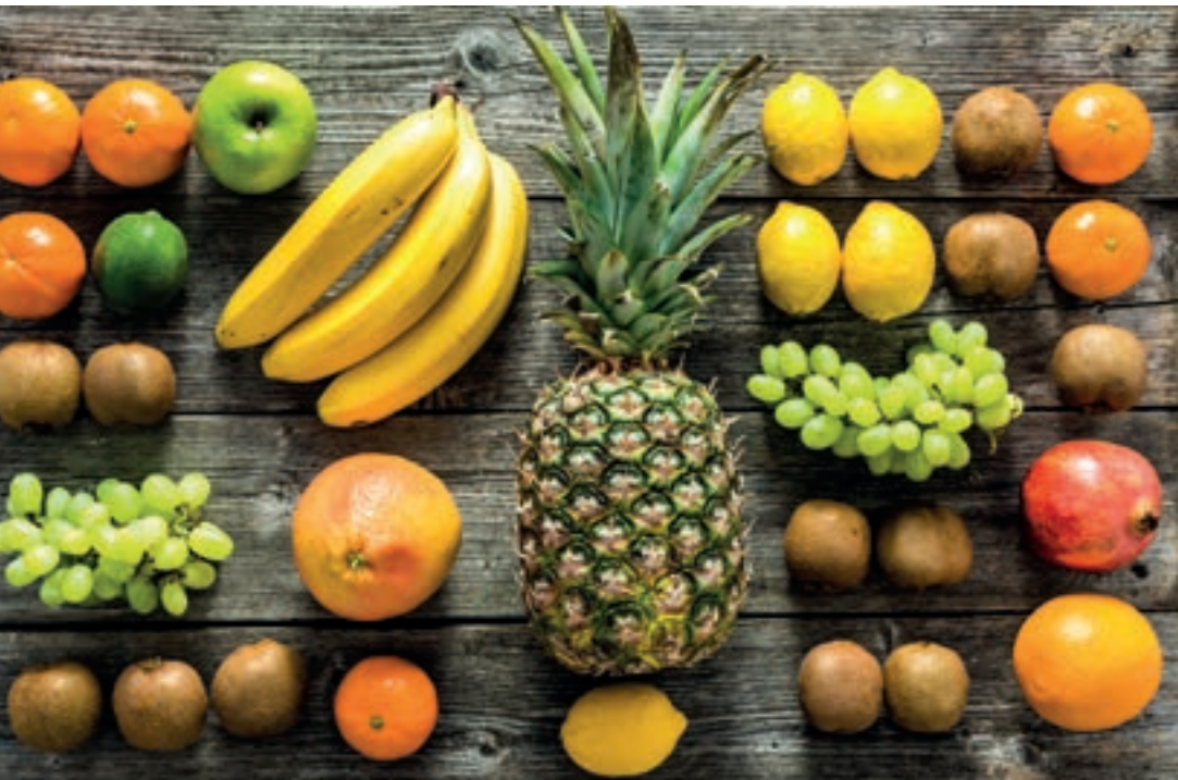
Für Kinder mit Fruktoseunverträglichkeit heißt es: Hände weg von süßem Obst!