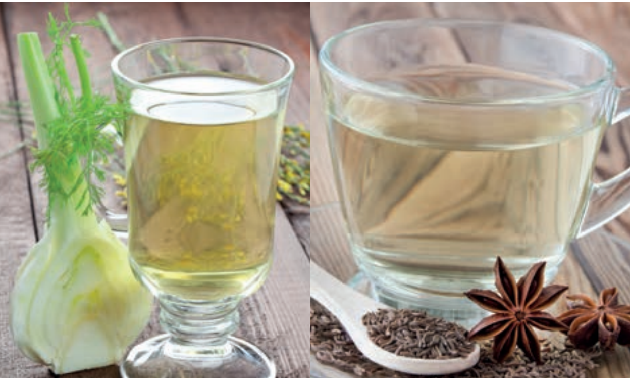
Tees mit Fenchel, Kümmel und Anis wirken gut gegen Blähungen.