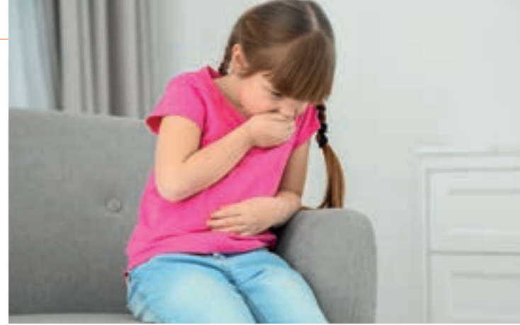
Bei einer Lebensmittelvergiftung ist der Durchfall auch von Übelkeit und Erbrechen begleitet.