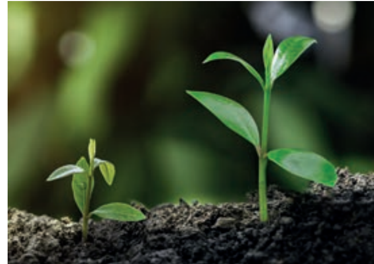
Klein- und Großwuchs gibt es auch im Pflanzenreich.

Wichtig ist die Früherkennung behandelbarer Formen des Kleinwuchses und deren entsprechende Therapie. Besteht eine Grunderkrankung oder eine Schilddrüsenstörung, so müssen in erster Linie diese behandelt werden. Kleinwuchs, der auf einen Mangel an Wachstumshormon zurückzuführen ist, kann mit der Gabe von Wachstumshormon behandelt werden. Das Hormon kann von den Eltern mittels Pen unter die Haut des Kindes gespritzt werden.