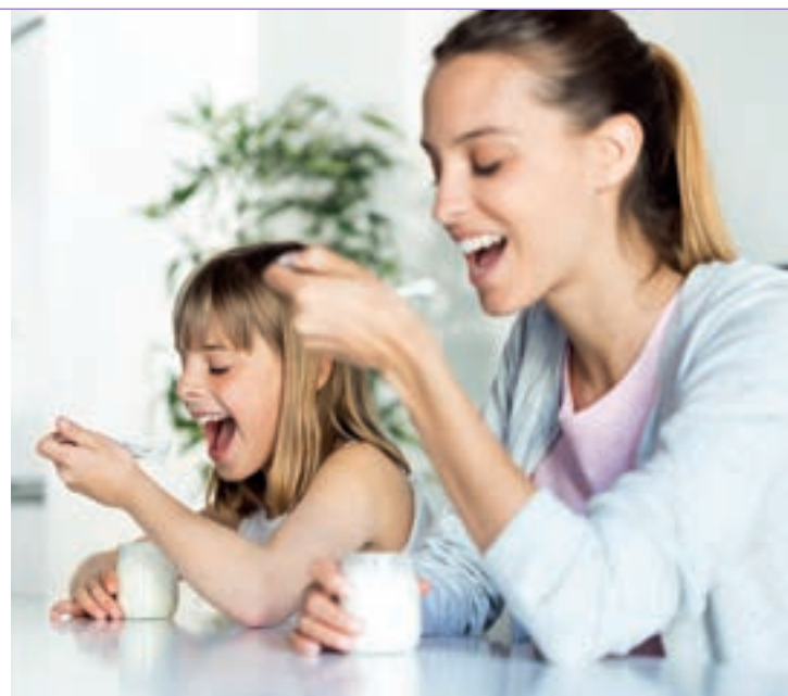
Gesundes Essen macht Spaß!

Milch und Milchprodukte sind wichtige Kalzium- und Eiweißlieferanten und für den Aufbau von Knochen und Zähnen besonders wichtig. Bis zu 3 Portionen Milch und Milchprodukte täglich werden empfohlen. Bieten Sie Abwechslung: Ideal sind 2 Portionen weiße Produkte – Milch, Butter- und Sauermilch – sowie 1 Portion gelbe Produkte wie Käse.