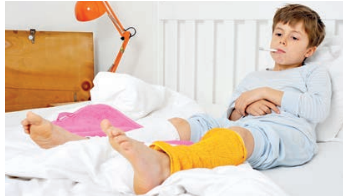
Wadenwickel senken das Fieber langsam.