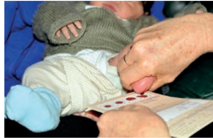
Aus der Ferse des Neugeborenen werden einige Blutstropfen entnommen.

Um möglichst bald nach der Geburt angeborene Erkrankungen zu erkennen, gibt es in Österreich ein systematisches Untersuchungsprogramm zur Früherkennung seltener Erkrankungen, das sogenannte Neugeborenen-Screening. Solche angeborenen Erkrankungen kommen zwar nur selten vor, jedoch ist deren frühzeitige Erkennung innerhalb der ersten Lebensstage Voraussetzung für eine wirkungsvolle Behandlung.