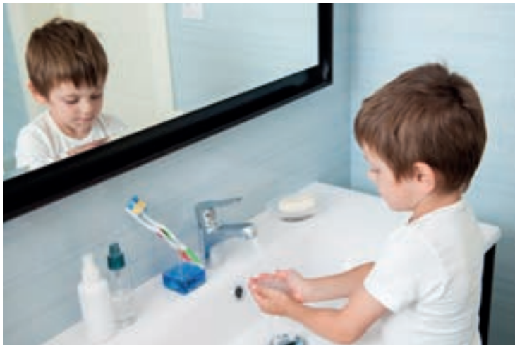
Handhygiene ist wichtig. Manchmal wird das Waschen allerdings zum Zwang.

Häufige Zwangshandlungen sind Kontroll-, Ordnungs-, Zähl-, Wasch- oder Putzzwänge.