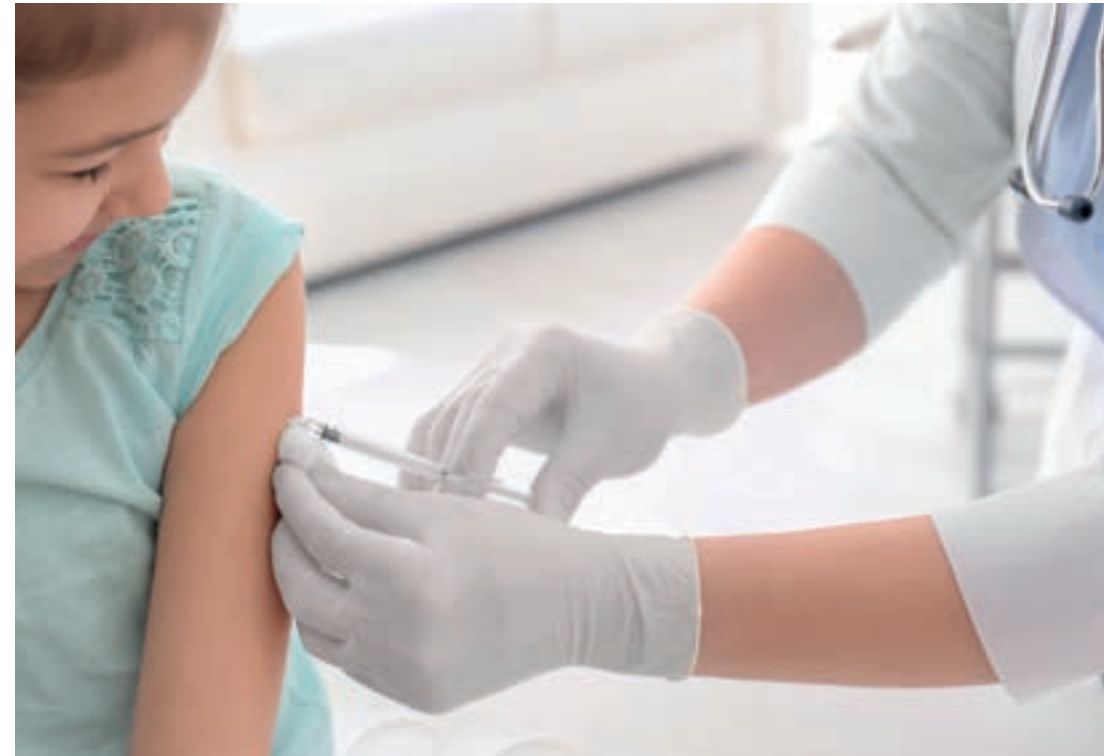
Impfungen schützen Ihr Kind vor gefährlichen Infektionskrankheiten.