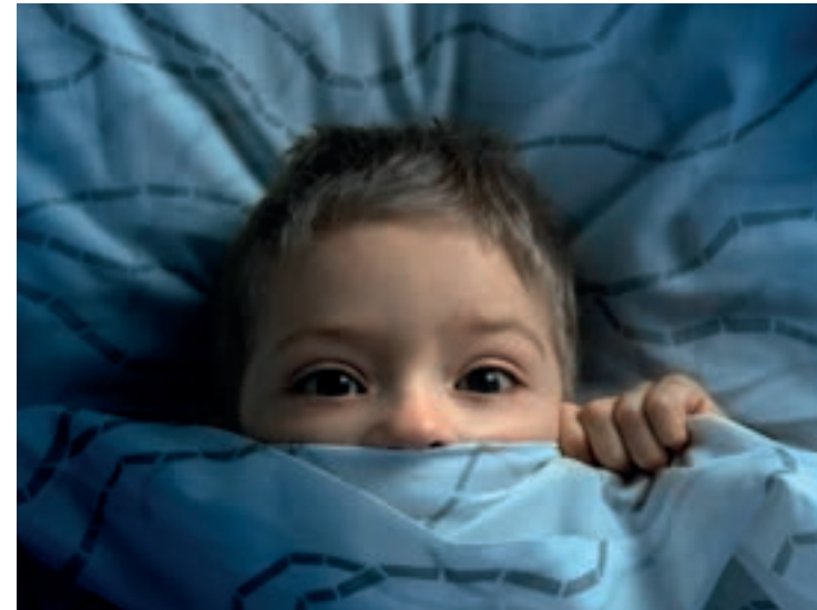
Bis zum 5. Lebensjahr sind Ängste vor Gespenstern und Dunkelheit normal.

Ängste sind ebenso wie Aggressionen „normaler“ Bestandteil jeder kindlichen Entwicklung. Entwicklungsbedingte Ängste treten meist in einer Zeit der Veränderung auf und verschwinden von selbst wieder. Nehmen Ängste jedoch überhand oder dauern sie über die jeweilige Entwicklungsphase hinaus an, ist Handlungsbedarf gegeben.