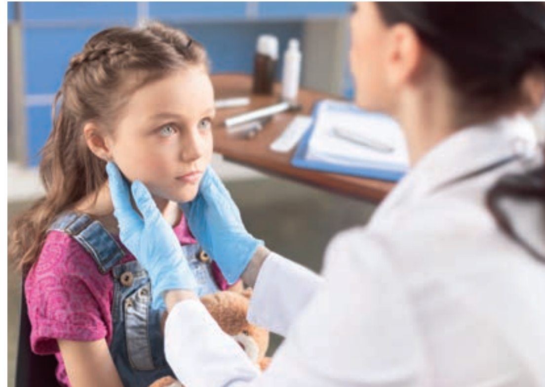
Anfangssymptom sind schmerzhafte Lymphknoten.

Eine Entzündung des Gehirns ist bei etwa 1 von 6.000 Erkrankten möglich. Die am meisten gefürchtete Komplikation ist die Infektion mit dem Rötelnvirus während der Schwangerschaft. Hier sind starke Organmissbildungen des Embryos zu erwarten.