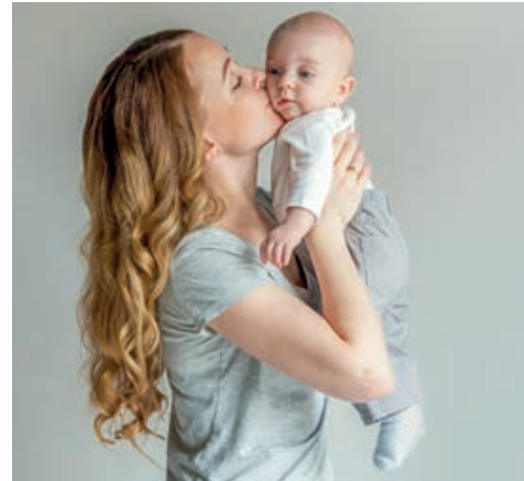
Ein gesundes Kind ist das größte Geschenk für eine Mutter.

Der Mutter-Kind-Pass bzw. die darin vorgesehenen Untersuchungen sind gesetzlich zwar nicht vorgeschrieben, aber der lückenlose Nachweis der ersten fünf Untersuchungen des Kindes sowie die fünf Untersuchungen der Mutter in der Schwangerschaft sind Voraussetzung für die Gewährung des vollen Kinderbetreuungsgeldes ab dem 21. Lebensmonat. Die Untersuchungen sind bis zum 15. Lebensmonat des Kindes nachzuweisen.