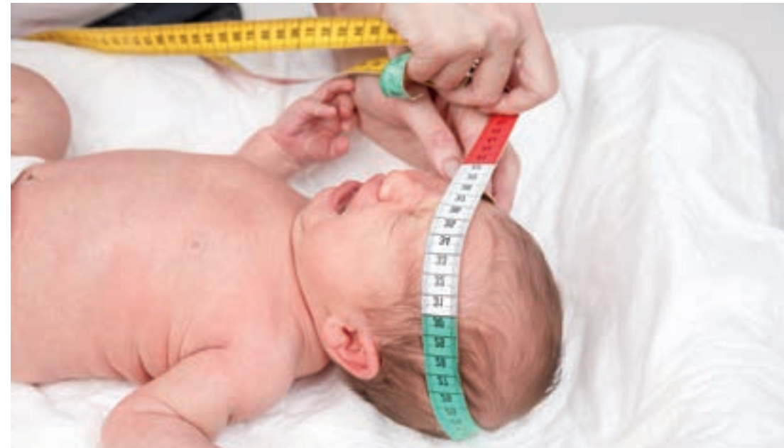
Nach der Geburt wird u.a. der Kopfumfang gemessen.

In Österreich gibt es seit 1974 den Mutter-Kind-Pass, der genau vorgibt, in welchem Alter welche Untersuchungen erfolgen sollten. Zur Förderung und Erhaltung der Gesundheit von Mutter und Kind wird ein kostenloses Untersuchungsprogramm für die Schwangere sowie für das Kind bis zu seinem 5. Lebensjahr angeboten. Die Ergebnisse werden im Mutter-Kind-Pass eingetragen.