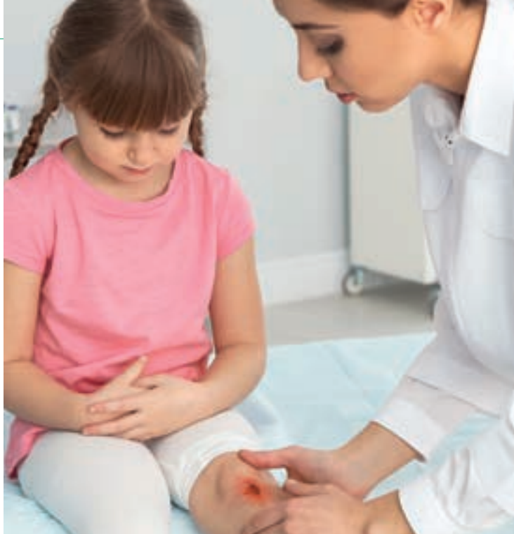
Offene Wunden müssen ärztlich versorgt werden.