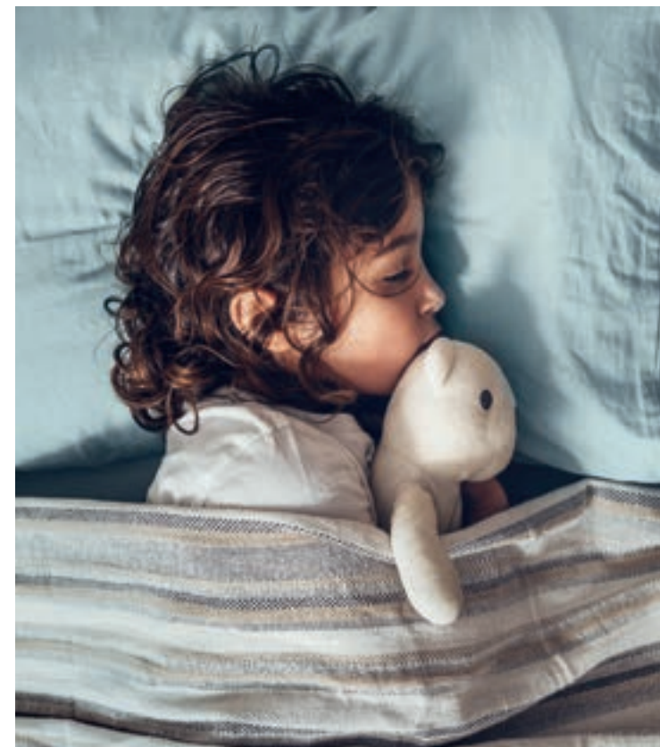
Bei Ringelröteln ist Bettruhe angesagt.

Isolieren Sie Ihr Kind, damit sich andere nicht anstecken, und vermeiden Sie vor allem den Kontakt zu schwangeren Frauen sowie Frauen, die nicht gegen Röteln geimpft sind.