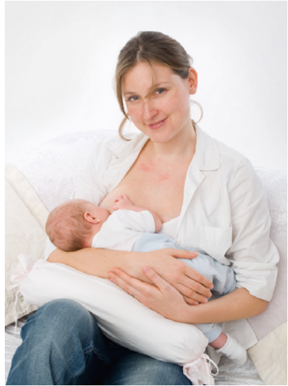
VSLÖ, © www.karlgrabherr.at

Dann ziehen Sie das Baby rasch ganz nahe heran. Es ist wichtig, dass das Baby beim Stillen nicht nur die Brustwarze selbst, sondern auch einen Teil des Warzenhofes in den Mund